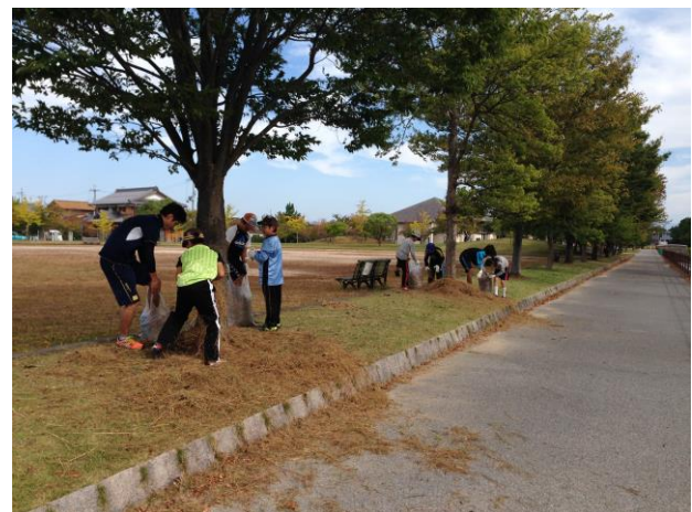
活動場所の清掃活動に参加