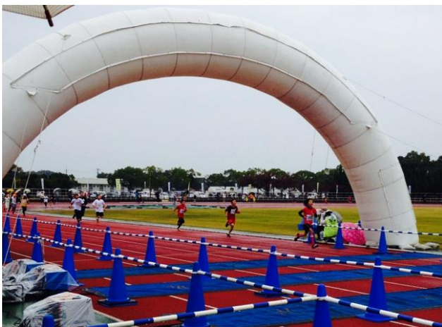
彦根シティマラソン